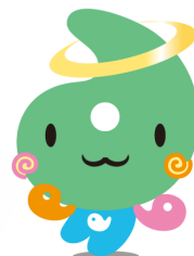
埼玉県社協マスコット 「シャキたまくん」

https://jinzai.fukushi-saitama.or.jp/kaigoloan_2.html